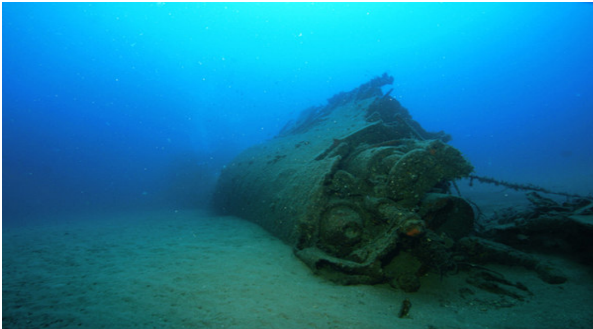
ה"שירה" במפרץ חיפה

מאז שוכבת הצוללת שירה על קרקעית הים במקום בו שקעה, כ-11 ק"מ מנמל חיפה ובעומק 32 מטרים. בעוד אחותה הצעירה 'Scire' S 526 פרי פיתוח איטלקי / גרמני, משרתת משנת 2006 בצי האיטלקי. http://www.marina.difesa.it/sommergibili/scheda.asp#Classe%20Todaro