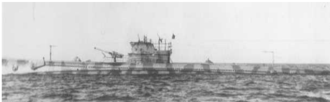
Smg. Adua בשנת 1941 עם צריח מונמך וצבעי הסוואה