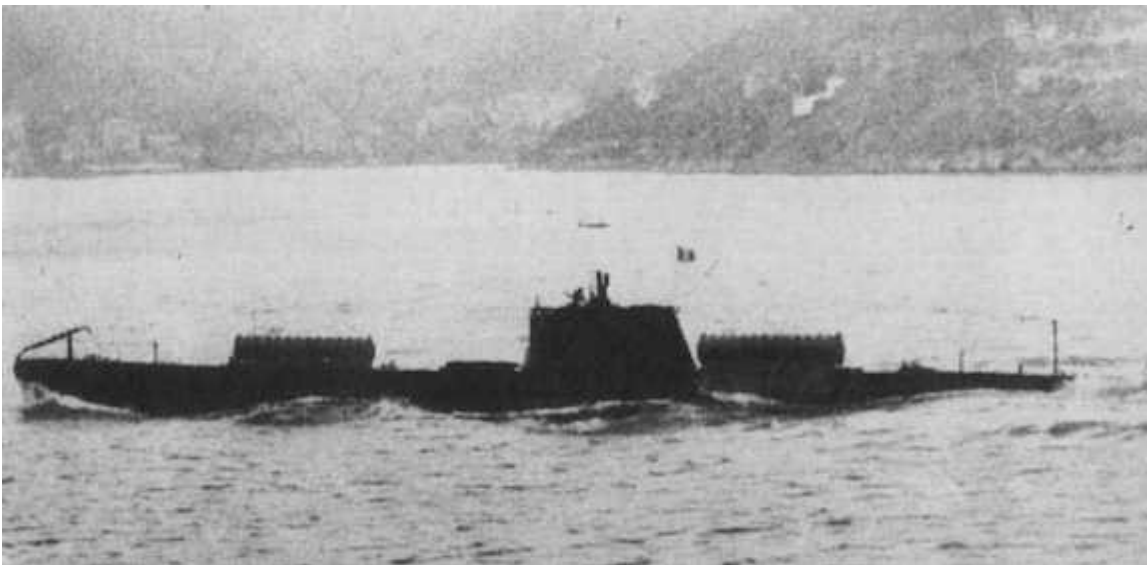
ה'שירה' מול נמל לה - ספציה.

השירה נבנתה יחד עם תשע צוללות נוספות בין השנים 1937-1938 במספנות OTO שבאיטליה. לאחר השקתה הצטרפה לשייטת 15 בבסיס חיל הים האיטלקי בלה-ספציה. בתחילת מלחמת העולם השנייה, בסיום סידרת אימוני כשירות שעוברים הצוללת וצוותה, ביצעה השירה מספר גיחות התקפה על ספינות בריטיות, ב 10 ביולי 1940 תחת פיקודו של סגן פיני הטביעה השירה בעזרת טורפדו את ספינת הקיטור הצרפתית S/S Cheik כאשר מפקד הצוללת מציל עשרה מלחים צרפתיים שנמלטו מספינתם השוקעת.מיד לאחר קרב זה שונתה משימתה של השירה ולשם כך היא עוברת במספנות לה-ספציה שיפוץ שיאפשר לה לשאת נשק 'סודי' חדש שנקרא SLC "חזיר" לשם התקנת החזירים הוסר תותח החרטום של השירה ובמקומו הורכבו שלושה מיכלים טורפדו אטומים לנשיאת החזירים.