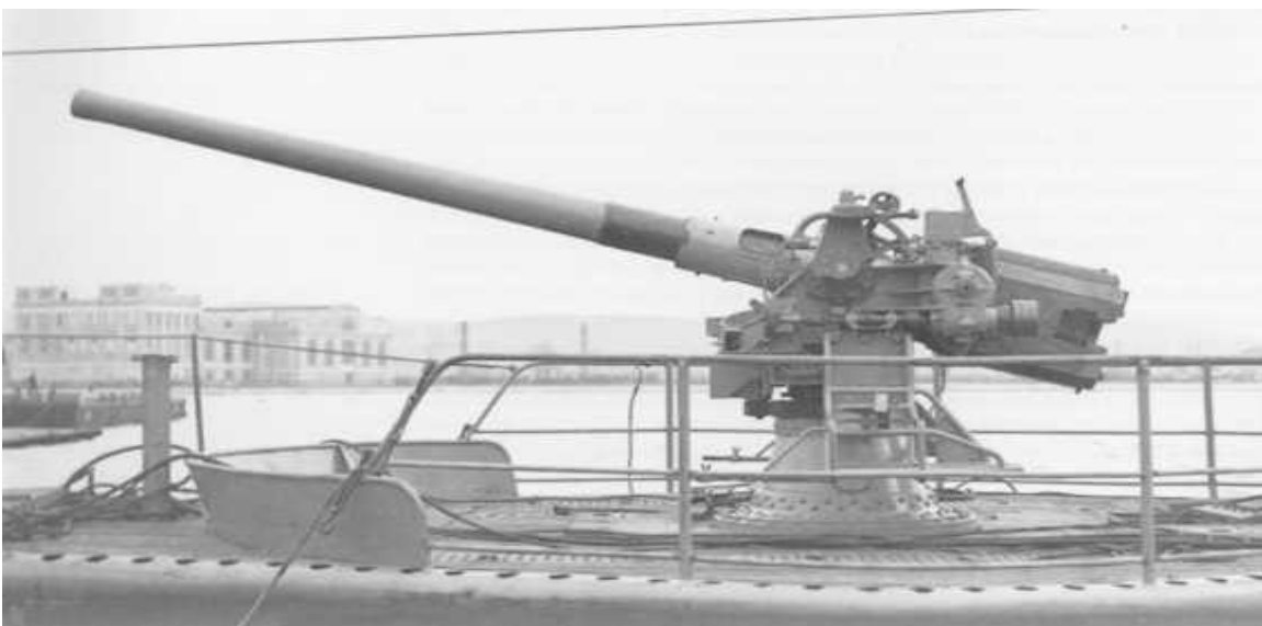
* עם התקנת צינורות איכסון החזירים, (SLC) הוסר תותח ה 102 מ"מ מסיפון הצוללת. Smg Profido