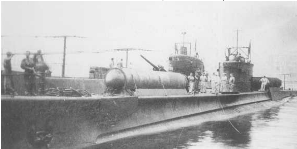
Adua Class מפרט טכני

סדרת ה Adua אליה השתייכה ה"שירה" כונתה גם בשם "Africani" ושמות הצוללות נגזרו מארועים הקשורים למערכה האפריקית. הצוללות מדגם זה נבנו במטרה לשמש בהפלגות קצרות, הן היו עמידות וקלות לתמרון אך מהירות השיט האיטית שלהן על פני המים הוותה נקודת תורפה.