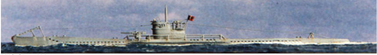
VIIC Class U-boat